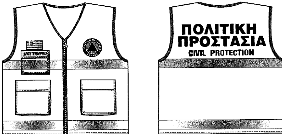
Εικόνα 2. Επιχειρησιακά γιλέκα Πολιτικής Προστασίας

Αναλυτικές προδιαγραφές για την εμφάνιση των επιχειρησιακών μπουφάν και γιλέκων Πολιτικής Προστασίας δίνονται στο 4678/22-11-2004 έγγραφο ΓΓΠΠ.