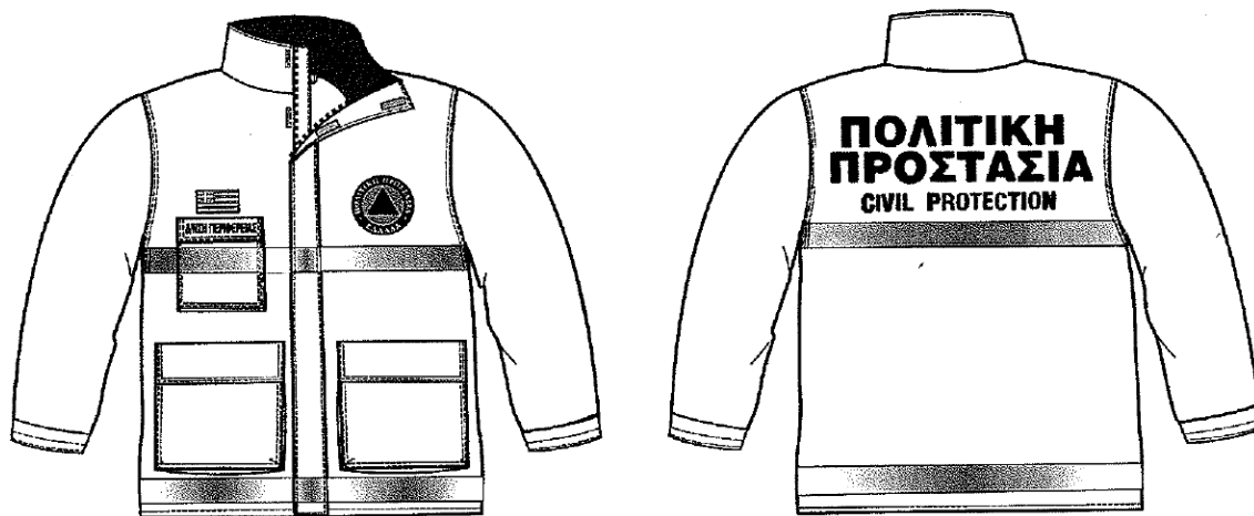
Εικόνα 1. Επιχειρησιακά μπουφάν Πολιτικής Προστασίας

Σύμφωνα με το 4678/22-11-2004 έγγραφο ΓΓΠΠ, τα επιχειρησιακά μπουφάν Πολιτικής Προστασίας θα πρέπει να έχουν την ακόλουθη μορφή: